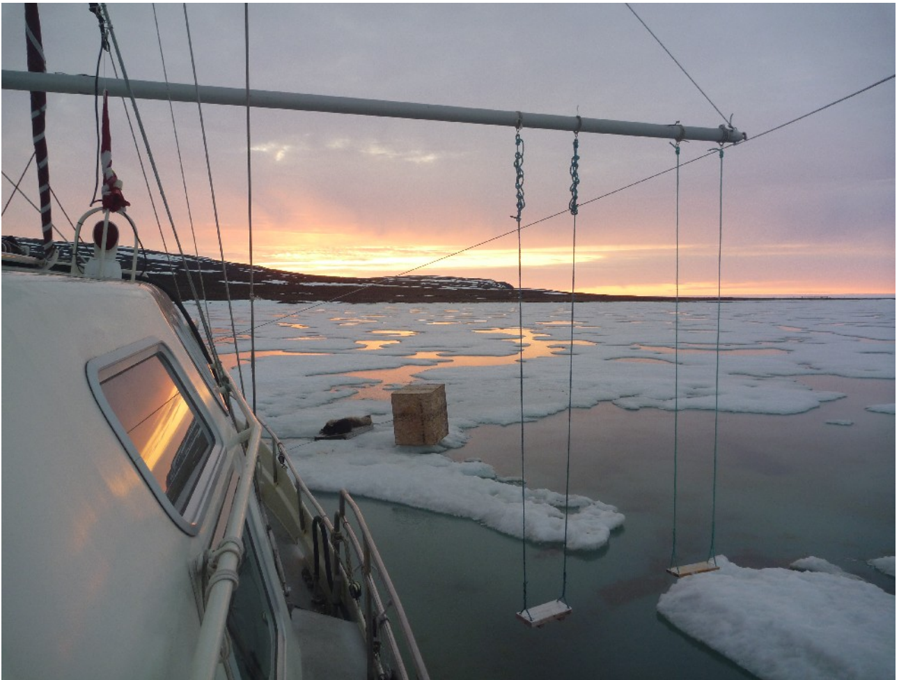
Soleil de minuit, au nord, fin d'hivernage.